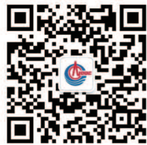
了解更多公司信息