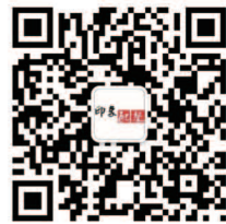
开启智选生活体验

总部地址：天津市滨海新区塘沽东沽石油新村612信箱 HQ Add: PO Box 612, Tanggu, Tianjin 邮编Postcode: 300452 电话Tel: 400-691-5599