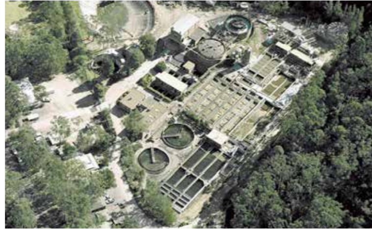
West Hornsby 污水处理厂， 澳大利亚

瑞好在澳大利亚的WEST HORNSBY污水处理厂做了一个关于RAUBIOXON硅橡胶和EPDM曝气管使用性能的对比实验。如下图所示在使用四年之后，RAUBIOXON硅橡胶曝气管的工作压力损失比EPDM曝气管低5kPa,等于比EPDM曝气管节省10%的风机能耗（利用理想状态下等熵压缩公式）。