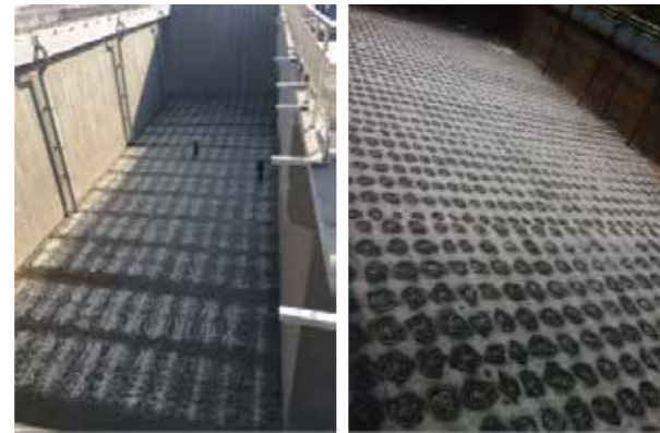
陕西咸阳污水处理厂

专业的项目管理团队确保每个项目以最优质按时完工。各个项目的安装调试由一名经验丰富的现场工程师负责。