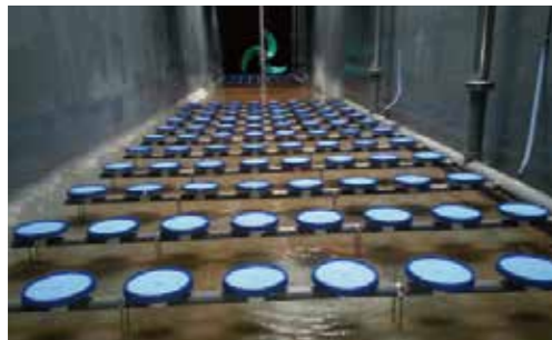
大亚湾西区污水处理厂，中国