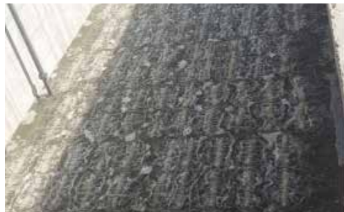
六盘水污水处理厂，中国