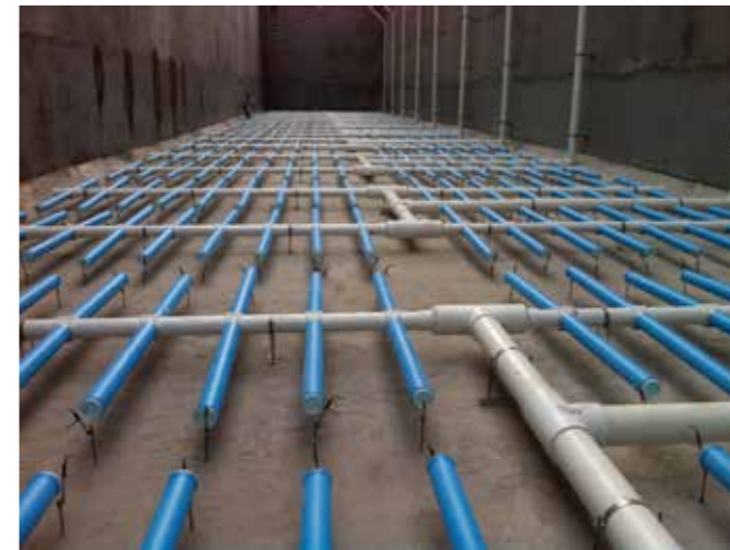
广东肇庆星湖污水厂