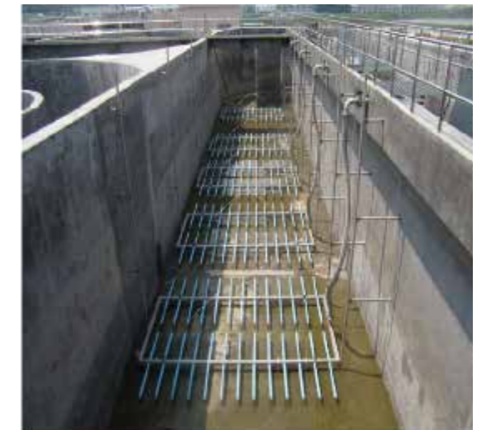
中山东升污水处理厂