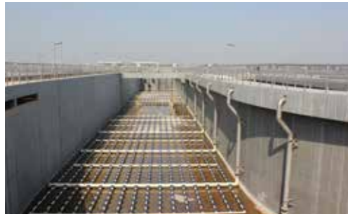
郑州新区污水处理厂，中国