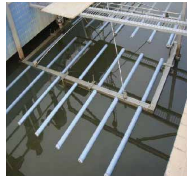
中山神湾污水处理厂