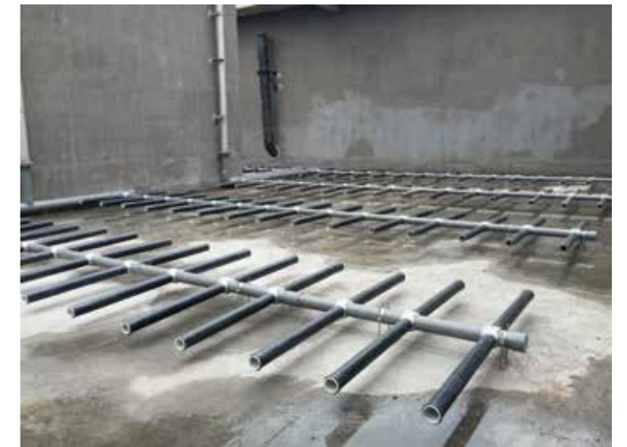
成都大邑县污水处理厂