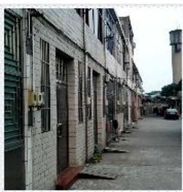
留在记忆里的 “泥桥头”