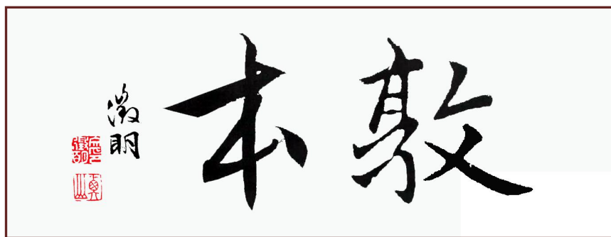
杭氏宗祠中堂内明代文征明书“敦本”二字